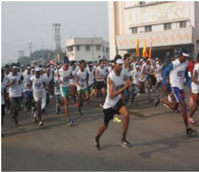
Participants running CleanAsansol Green Asansol Mission.