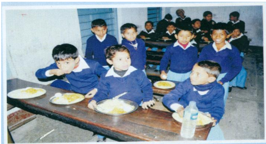
Mid-Day Meal Programme