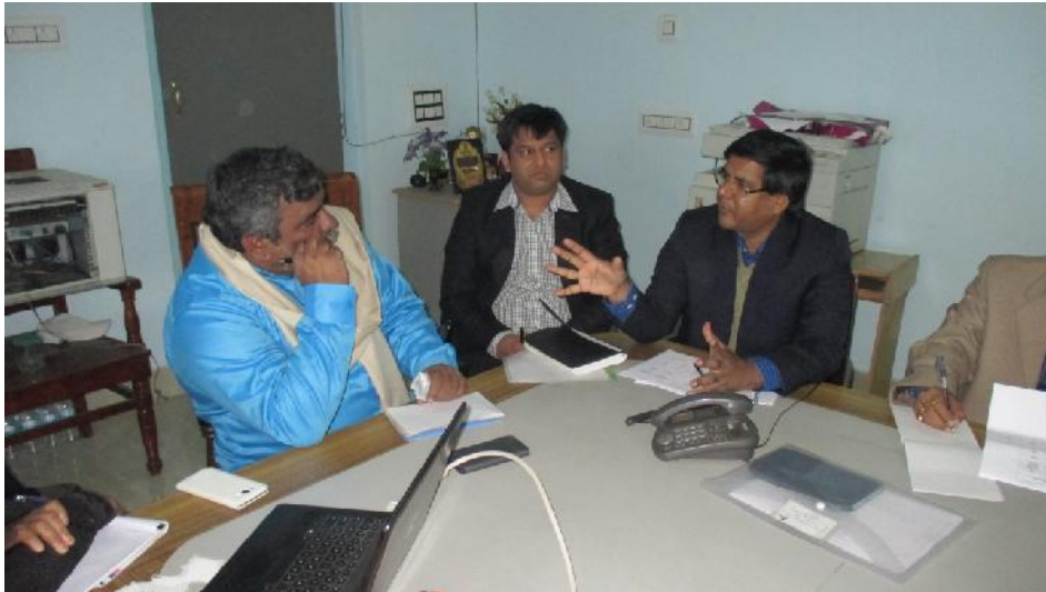
Photo: - Discussion about AMRUT, Housing For All (HFA), SBM, NULM, NUHM, NSAP Projects