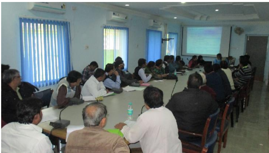
Photo: - Meeting regarding AMRUT, Housing For All (HFA), SBM, NULM, NUHM, NSAP Projects