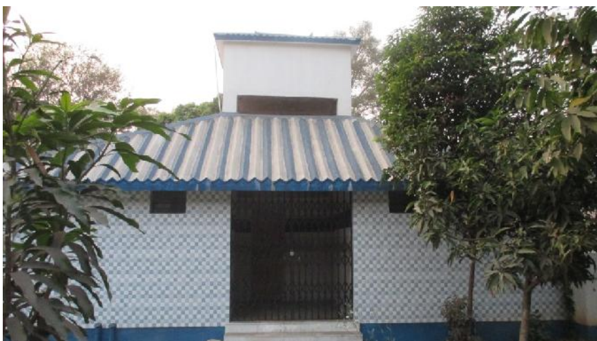
Photo: - Community Latrine