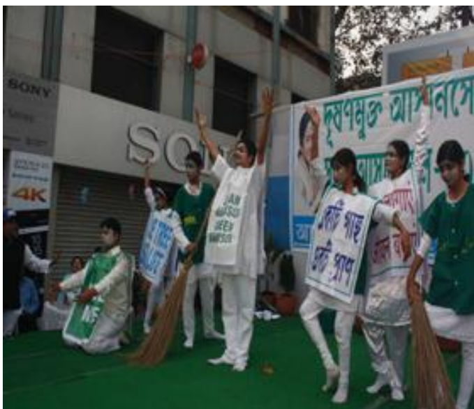
Participants running CleanAsansol Green Asansol Mission.