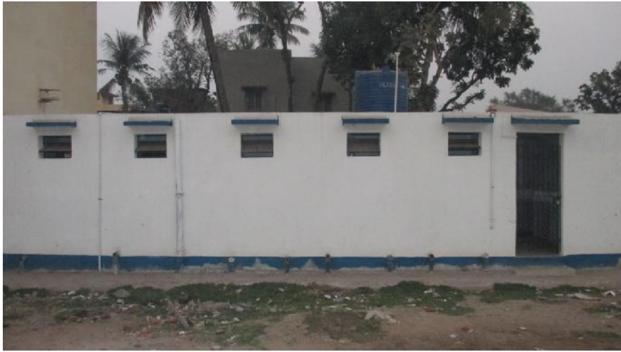
Photo: - Community Latrine