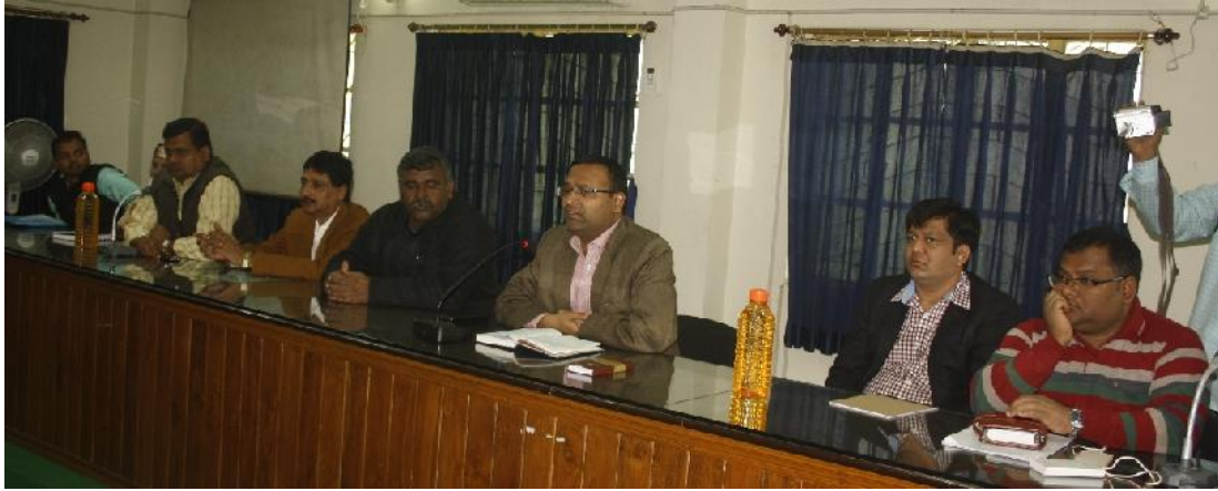
Mayor in meeting with DM ADM SDO regarding 10 rs meal service to be started in asansol