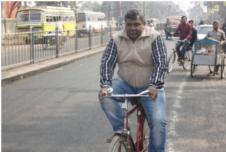
Car free day observed by mayor in asansol