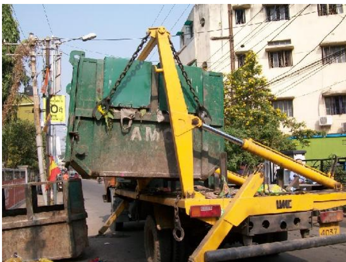
Daily Removal of Solid Waste