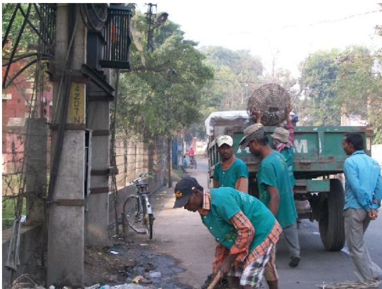
Daily Removal of Solid Waste