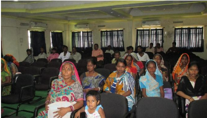
Rehabilitation Programme of Manual Scavengers in A.M.C. area