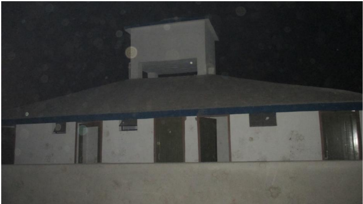
Photo: - Community Latrine